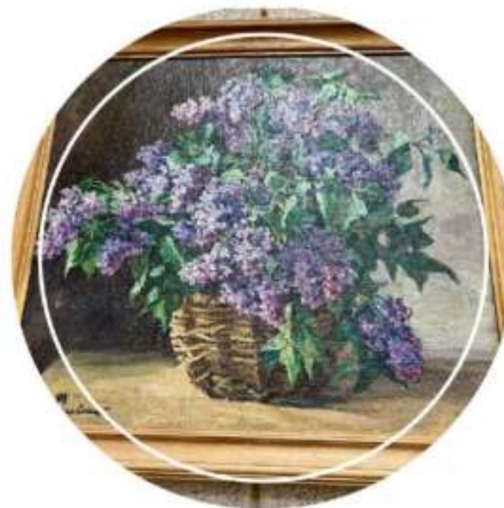
Новое выставочное пространство в Музее