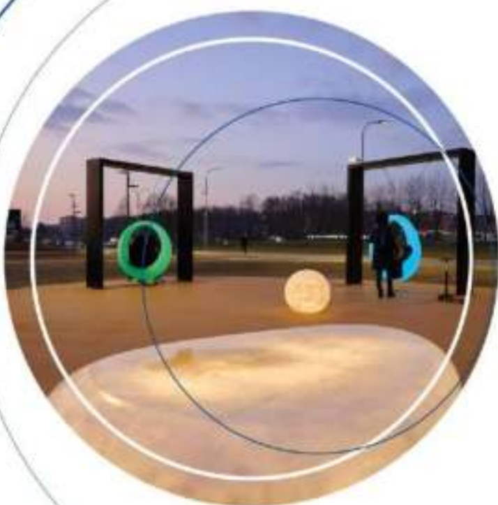
Территория у Дома ученых