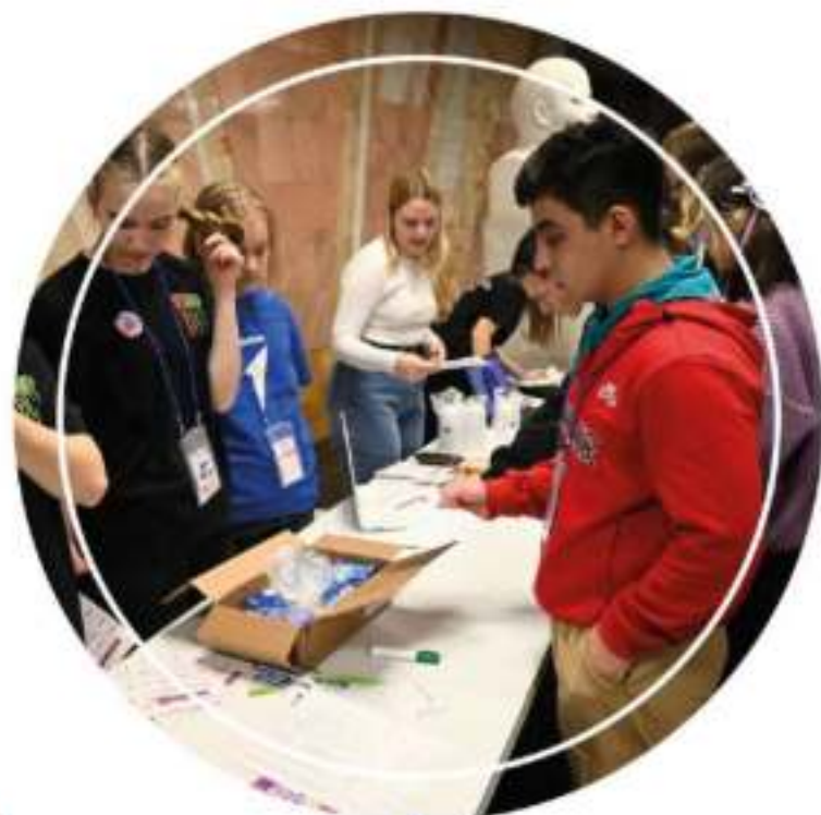
«Вальс Победы» городская акция