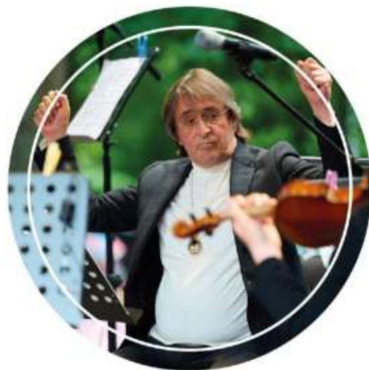
Концерт Юрия Башмета