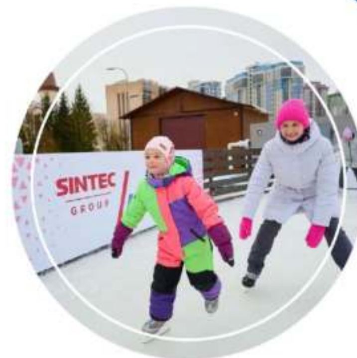
Каток у Дома ученых