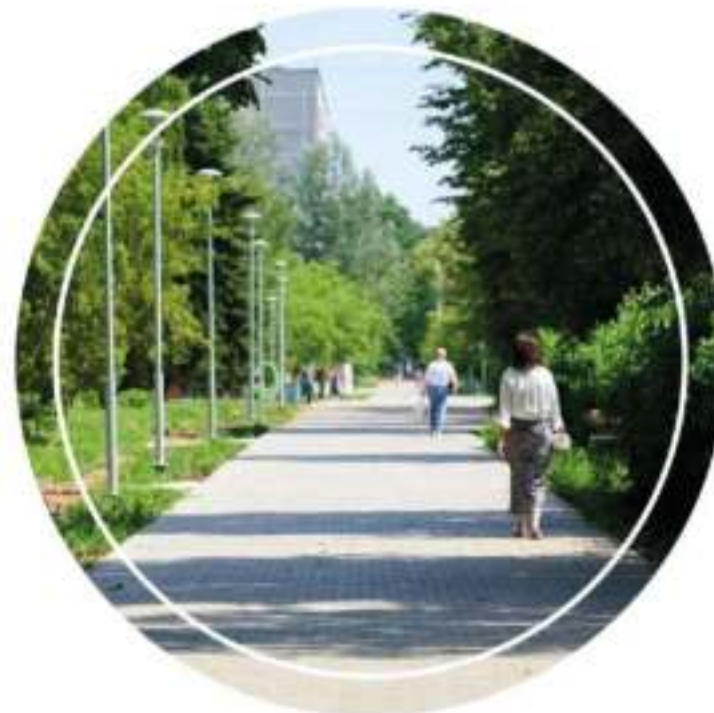
Пешеходная зона по ул. Энгельса