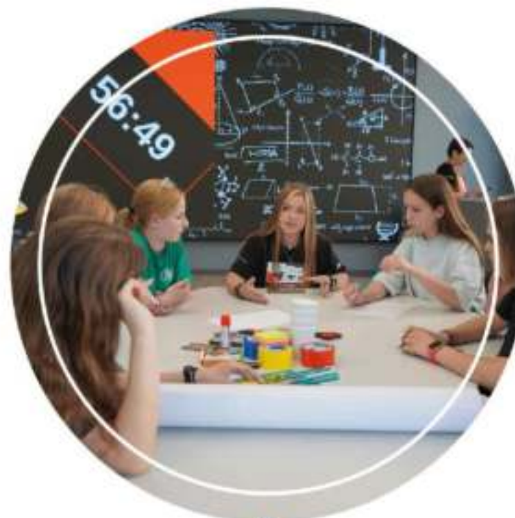
II Международный форум атомной молодежи Obninsk NEW