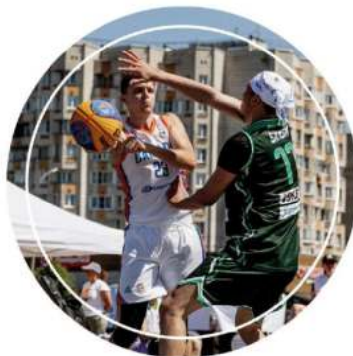
Баскетбол 3x3 «Оранжевый атом»