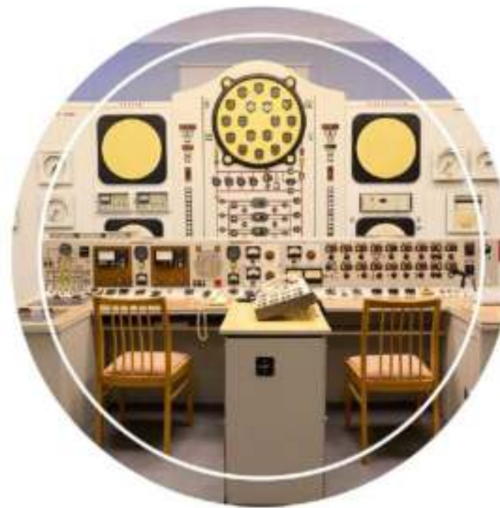
Обновленная экспозиция Первой в мире АЭС