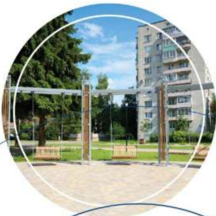
Сквер по ул. Комарова